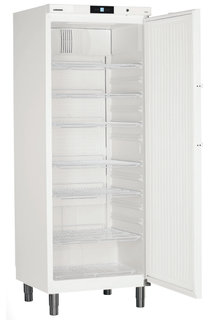
GKv 7110 X