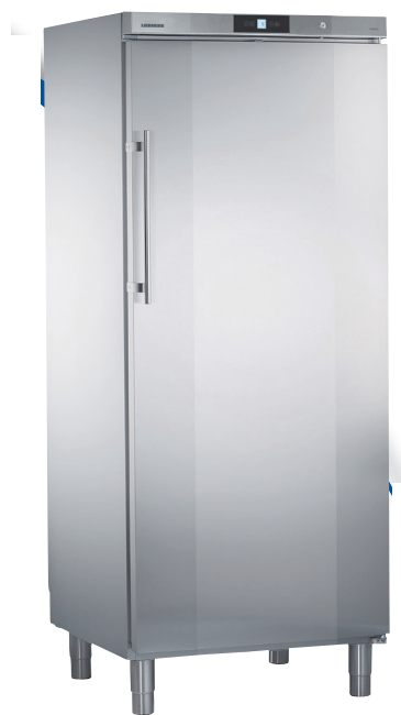
GKv 7160 x